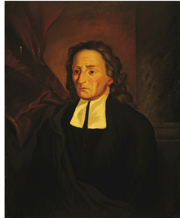
Giambattista Vico (1668–1744)